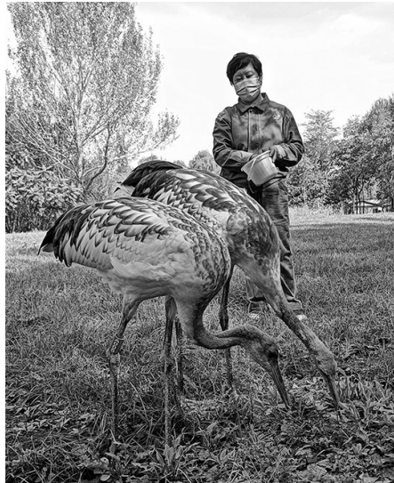
近距离观看丹顶鹤宝宝，萌翻了。

“萌新天团”怎么能少了可爱、软萌的丹顶鹤宝宝们呢？昨日，记者也去查看了鹤宝宝的成长情况。它们可谓是“鹤大八十变”，小时候黄溜溜一坨像个小鸡崽，如今它们长大啦，身体部分已经长出了很多白色羽毛，只少量点缀着栗色羽毛。它们时而优雅漫步、展翅跃翔，时而