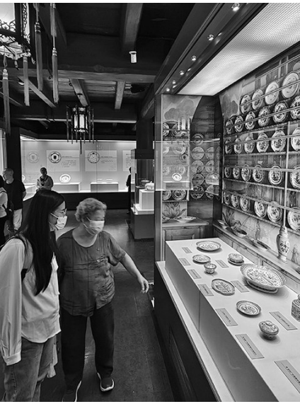
市民在展览现场观看。

纹章对持有人的性别、婚姻、子嗣、爵位和授勋情况都形成了一套严谨的展现和表达体系。婚姻在纹章中的第一种表达形式为“并置”式，即男女双方纹章并排放置在同一盾牌内，男方纹章在左，女方纹章在右。这种方式说明女