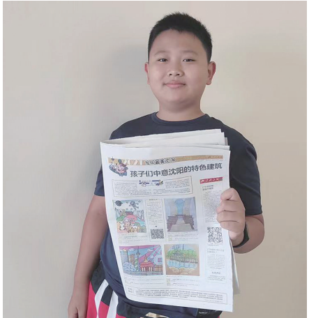
小画家的作品登上了《辽沈晚报》。