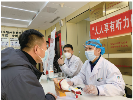
史党建教研部教授授课《回望党的历史 感悟初心使命使命》;在开展“微党课展播”活动中,13个党支

如何更好地把医疗技术服务于人民群众?如何更好的激发医护人员的使命感?沈阳市第四人民医院党委摸索出了成功的经验,他们以“忆党史 铭党恩 强党性 促党建”为主题开展党史学习教育,通过一系列医护人员喜闻乐见的形式来增强医护人员的奉献精神。 学习党史推动医院高质量发展 “知者行之始,行者知之成”。武装头脑的落脚点在指导实践,学懂弄通,落脚点在做实。近两年,沈阳四院通过推出“百年党史·每日一读”、“今日党史”天天学、《百年征程 百秒瞬间》领学等活动,让医护人员重温党史、回眸历史瞬间,强化了线上学习的平台阵地;同时邀请市委党校党