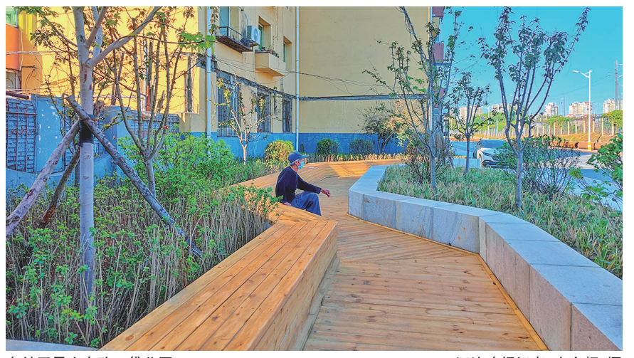
皇姑区昆山东路口袋公园。