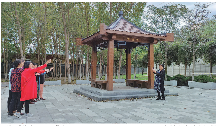
于洪区黄海路万里园口袋公园。