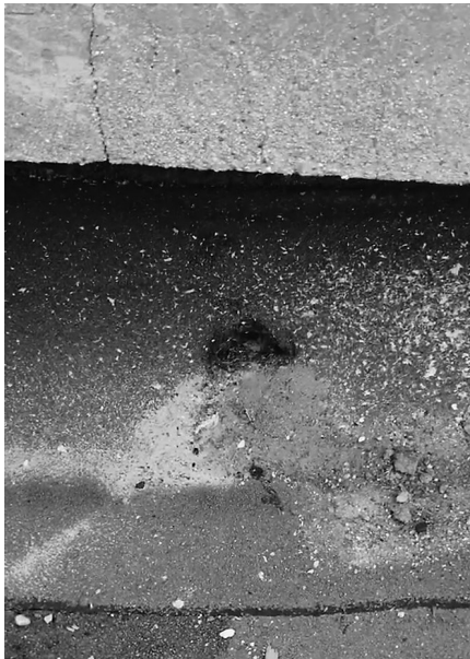
楼顶打眼儿处里面有积水。