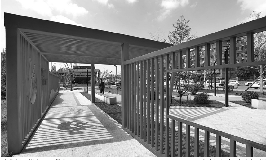
沈北新区悦湖园口袋公园。