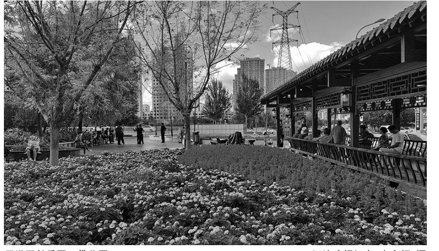
于洪区长乐园口袋公园。