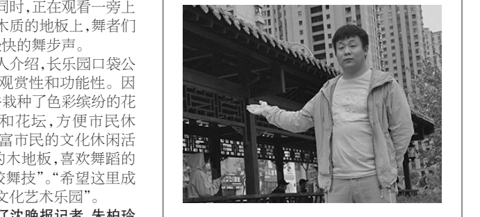
辽沈晚报记者 朱柏玲

推荐理由：在汀江街与松山路的交会处新建了一座口袋公园，非常漂亮。每次路过，我都想驻足欣赏一下花坛里栽种的五彩缤纷的花朵。