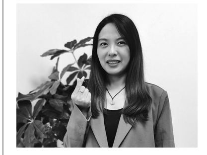
辽沈晚报记者 胡婷婷

推荐理由：地铁口的绿地全部打开，栽种了景观松，修建了广场连廊。运动达人可以跑步健身，老人小孩可以休闲散步。