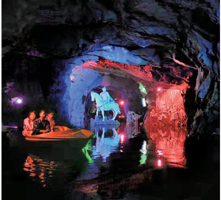
游客在沈阳水洞游玩。

在沈阳市苏家屯区白清姚千街道邓家沟村青龙山脚下,有一处清幽的所在,这里绿树环绕,一泓碧水在山下潺潺流淌,走近一看,原来山脚下有一个天然的山洞,洞口如敞开的半间房屋一般大,它就像这座山的嘴巴,饮一涨碧水入口。洞顶高数丈,洞底水路环绕,可以行船。这座山洞,当地人把它叫做藏军洞,也叫“沈阳水洞”。关于沈阳水洞,也有着一段美丽的传说。相传薛礼东征之时,曾经在此洞中藏军避难、休养操练,后来薛礼东征屡建战功,打败敌师,班师还朝。归途中他寻找当年避祸的山洞,发现它就藏在白清寨的一座小山脚下,于是他欣然为这座山洞命名为“藏军洞”。目前,已经是国家AA级风景区的沈阳水洞由唐王洞、白虎洞和藏军洞三个天然洞穴组成。当你坐着游船从入口进入水洞时,瞬间映入眼帘的就是变幻的灯光和变化的洞石造型。从“梦扰青龙”到“寒窑苦度”,经过“地穴得宝”“箭定天山”再到“班师还朝”“夫妻团圆”,18个串联起来的故事,完整地讲述了薛礼东征一路上发生的惊心动魄、凄美感人的故事。而这些浮雕故事不是写在书里,而是建在