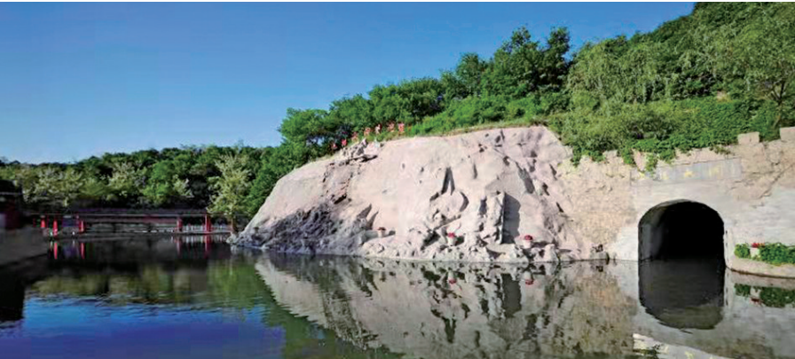
沈阳水洞置身在群山怀抱之中,洞外山川秀丽、鸟语花香。