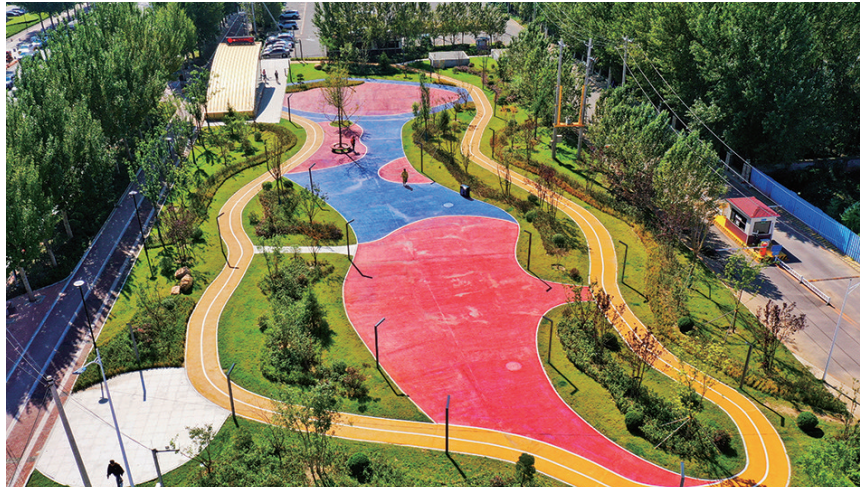
悦识园位于地铁辽宁大学站C出口西侧,占地面积1900平方米。

悦识园位于地铁辽宁大学站C出口西侧,占地面积1900平方米。原来就是一块普通的封闭绿地,市民无法进入到里面。建设口袋公园的一个要求就是打开绿地,让市民有活动休憩的场地。“这片绿地位于地铁口,周边还有商场和居民楼。人流量比较大,确实有休息活动的需求。”沈北新区园林管理科工作人员介绍,改造时,在绿地中间铺设了颜色鲜艳明亮的红色、蓝色和黄色的透水混凝土,在广场的外围则保留了绿地,并且保留了绿地中的乔木和大灌木。此外,为了方便市民休息,在广场中添置了一些座椅。为了大家晚上活动方便,还在广场一周都架设了路灯。“即使晚间,市民依然可以来这里散步乘凉。”“这块绿地能利用起来真的太好了,以前我们只能看看,现在可以进去跑步、散步、遛娃,给我们生活带来了很大的便利,也带给我们很多的幸福感。” 辽沈晚报记者 胡婷婷