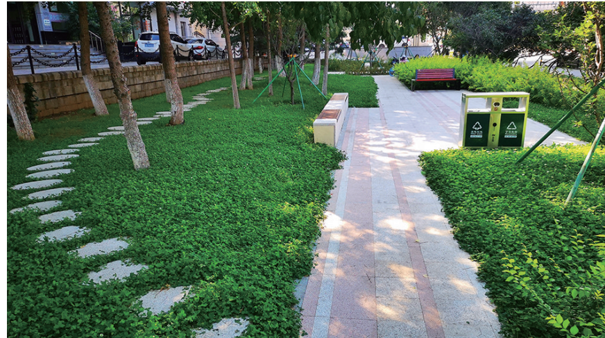
市府大路口袋公园。