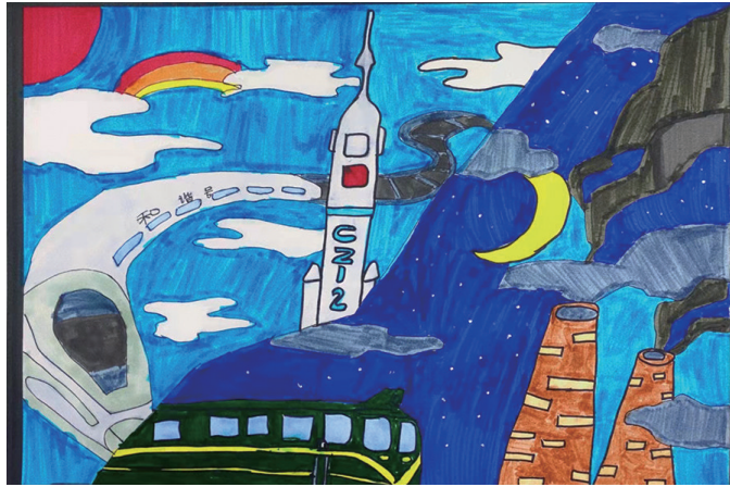
作者:吴思怡 8周岁 皇姑区天山一校

作品简介 《未来号》:以广阔的太空为背景,一支神奇而强大的未来号穿梭在中间,是那样耀眼而明亮! 指导教师 孟革因:小小的身体,大大的能量!愿未来的你可以乘风破浪,畅游在知识的海洋,为蔚蓝的海洋增添一抹绚丽的色彩!