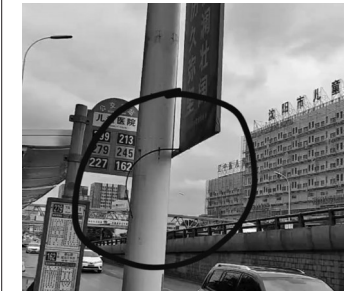
广告牌随风摆动，路过行人需留意。