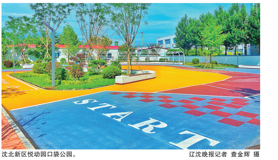
沈北新区悦动园口袋公园。 辽沈晚报记者 查金辉 摄