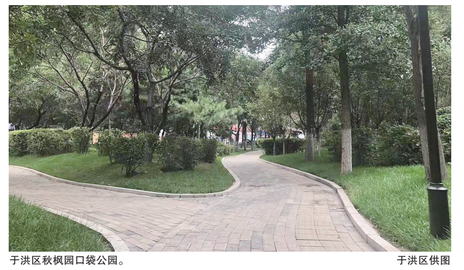
于洪区秋枫园口袋公园。