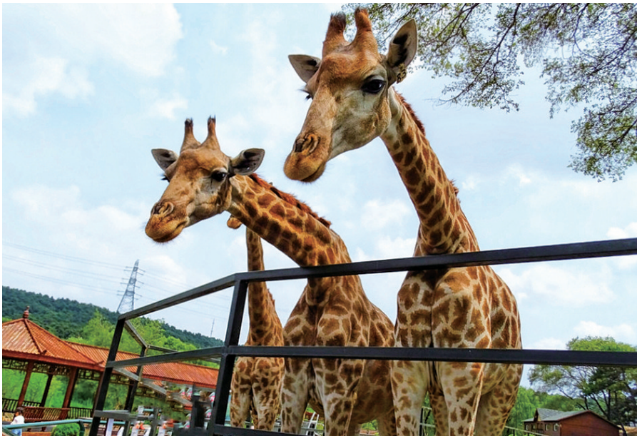
沈阳森林动物园“长颈鹿家族”来了新成员。

每天都有丹顶鹤飞翔行为展示，它们在蓝天下列队盘旋，姿态优美而刚健。感兴趣的游客可以在相应的时间前往观看。两栖爬行馆内，可以看到黄金巨蟒、缅甸陆龟、科莫多蜥蜴等两爬类动物40多种近百只。