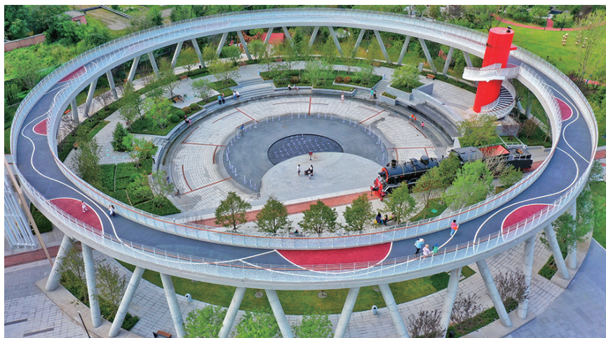
大东区时代口袋公园。