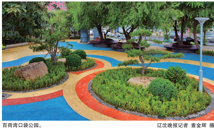
百荷湾口袋公园。