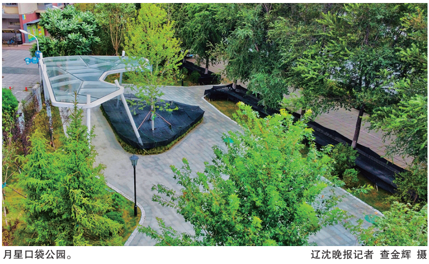
月星园口袋公园。