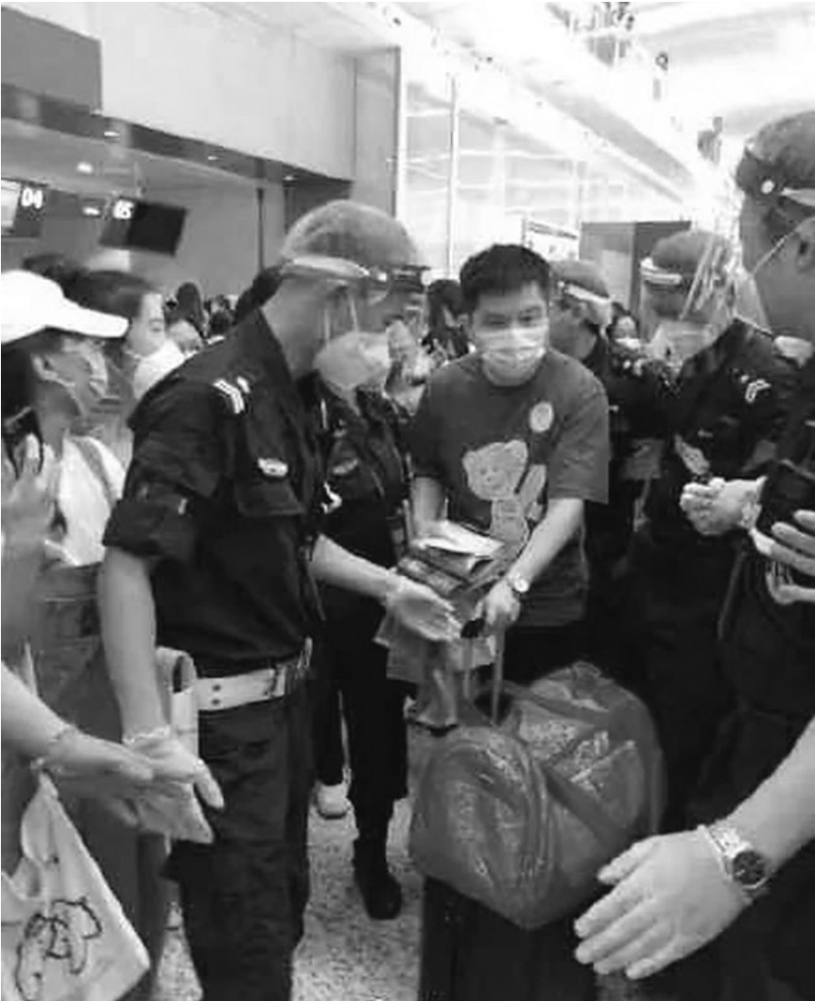
樊振东从广州出发征战全运时更是有不少粉丝前来送机。