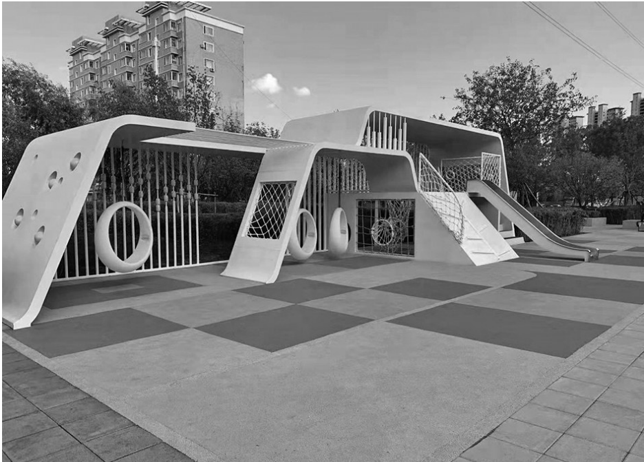
祥云口袋公园里的户外立体淘气堡。