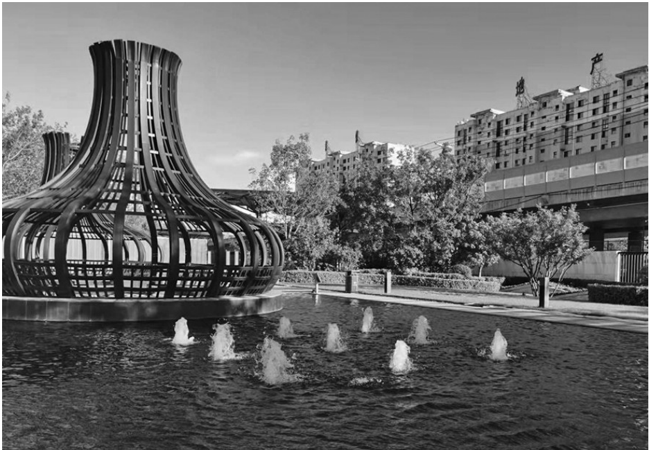
铁西区轻奢风口袋公园里凉亭的风格十分硬核,很有特点。