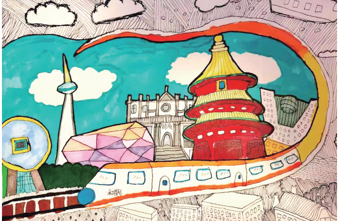
作者:李宇轩 11岁 勐望小学 作品简介 《飞奔的城市》:指导教师 张靖浩:作品主题鲜明,构图用线描和水彩笔搭配巧妙用心。