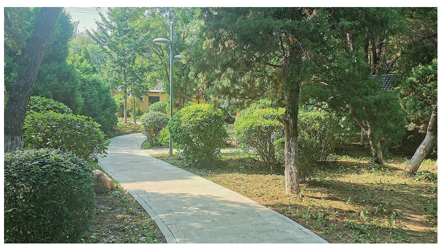
和平广场口袋公园主要方便老人和小孩使用。