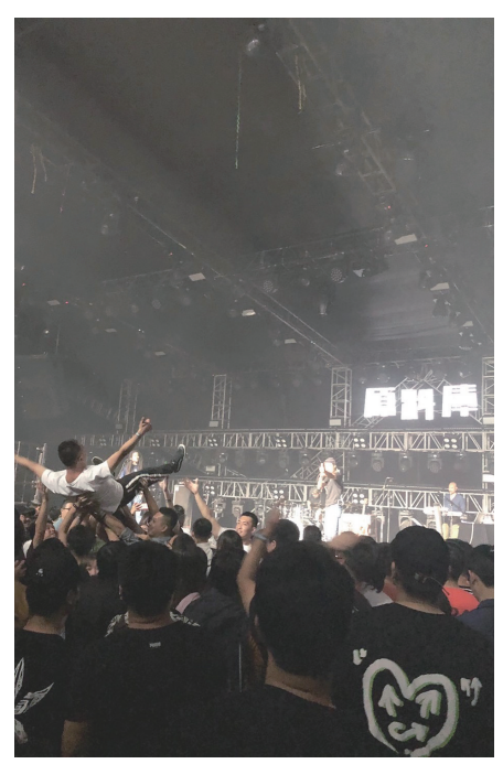
辽沈晚报记者 隋冠卓

原料库迄今已经做了 50 余场演出，“演出单位来沈阳，我都会给他们提供最好的待遇，乐器都是我出车拉回来，再加上最专业的设备和场地，他们对沈阳乃至对东北的印象就会特别好。”大牛介绍。 最近大牛组了一个叫“超级工场”的乐队：“也是对这个城市和过去的回望，沈阳就是共和国的超级工厂。”40 岁的他担任主唱，依旧在舞台上意气风发，骨子里的“少年感”吸引了不少年轻人。 在沈阳越久，大牛说自己越喜欢这个城市，喜欢这个城市的工匠精神。 大牛说：“定名时我决定就用它原来的‘原料库’这个名字，这是一种传承，希望让更多年轻人知道大沈阳铁西的工业精神。” 这个月末，就是原料库 LiveHouse 启动三周年的日子，当天还会有一场由四个年轻人很喜欢的乐队组成的演出；而李大牛会时常想三年前启动当天，也正是红梅文创园开园，有祖孙三代相携站在原料库门口，外婆、妈妈和外孙女，外婆笑着笑着就哭了：“我十五岁进厂上班，在这干了一辈子，怎么现在这还叫原料库啊！” “感谢你用音乐珍藏我们共同的铁西。”这是最近一场演出结束后，一位沈阳本地乐迷给李大牛的留言。