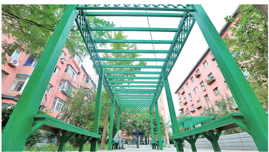
南五经街口袋公园绿色长廊方便了市民休闲娱乐。