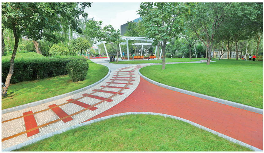
铁西区劝工口袋公园。