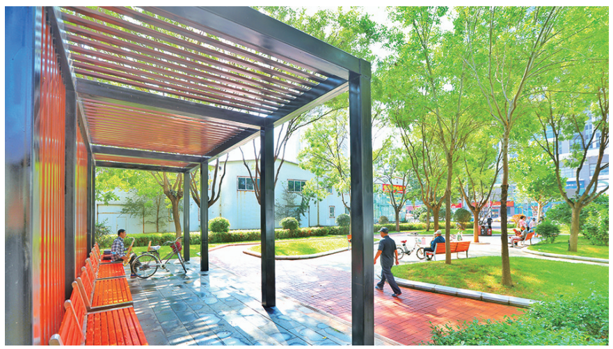
铁西区云峰口袋公园。