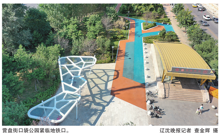
营盘街口袋公园紧邻地铁口。