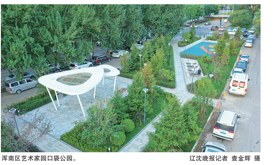
浑南区艺术家园口袋公园。