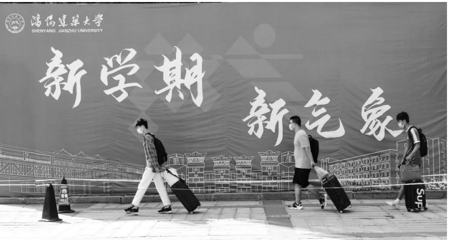
9月4日至6日,沈阳建筑大学全体学生按照先省外、后省内顺序分批错峰返校。

“你好,同学,欢迎回家!”学校在正门口设置了等待区、测温验证区、临时隔离区。 9月4日,沈阳建筑大学2021年秋季学期首批来自省外的研究生和本科生满怀喜悦返回校园。据悉,根据学校相关安排,9月4日至6日,全体学生按照先省外、后省内顺序分批错峰返校。 记者了解到,报到现场学生间隔排队,依次佩戴口罩入校,按照“一测二查三核四过五签到六检测”流程办理报到手续。人员引导、体温检测、身份核验、查看个人行程码、核酸检测阴性证明、入校登记、接待服务等工作一气呵成,省外非重点管控地区返校学生按要求进行了返校后的二次核酸检测,随后乘坐校园摆渡车抵达宿舍,进行体温复检、入寝登记。学校各单位、各部门密切配合、群策群力,整个过程严谨而有序。暖心的问候、贴心的叮嘱、细心的服务让学生倍感亲切,安静的校园顿时生机勃勃、温情满满。