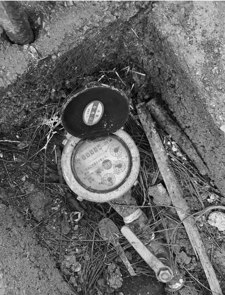
当地村民家用了两年的水表几乎未走字。

对于水龙头没水的情况，当地乡镇干部、村干部解释称，喀斯特地貌存不住水，新光村没有明显地表水源，比周边更干旱。这两年政府安装自来水设施，从山里引来泉水。泉水有限，要分时段供应，各村民小组隔几天就能轮到，水存起来够一家人用一周。 和干部们碰头后，督查组禁止其跟随，继续在村里走访。接下来抽查到的村民家，水龙头均有出水。 随着督查持续深入，越来越多的村民围上前反映：“平时一滴水没有，领导来了水才来。” 督查组随后摸排发现：点名要去某村民家，