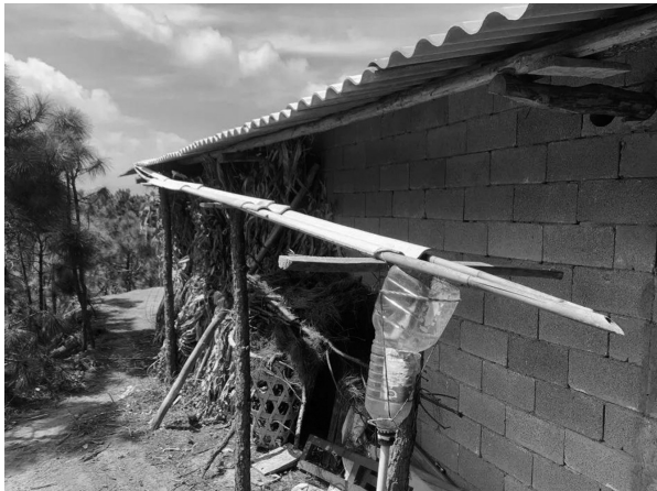
村民家自制的接雨设施。

委会，确保每一处农村供水工程都有人管；各地要加快农村饮水安全巩固提升工程建设进度，严把工程建设质量关，并探索后期维护长效机制；水利部门要和卫生健康部门共同研究提升农村供水水质达标率，全力配合统计等部门普查等工作，提供基础资料和技术支持。 此外，要畅通举报渠道，建立问题办理和回访机制，对村民关切的问题给出合理解释，让村民吃上“明白水”“放心水”。