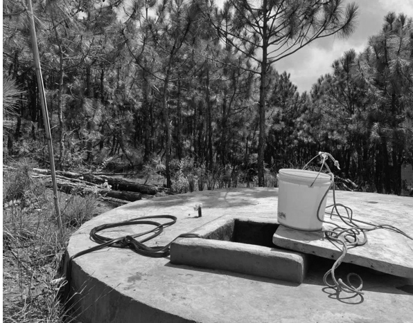
村民自家储存雨水的水窖。