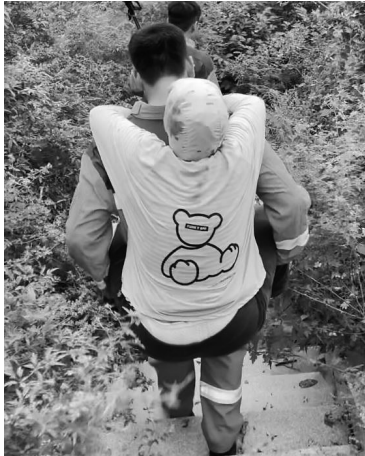
消防救援人员将老人背下山。