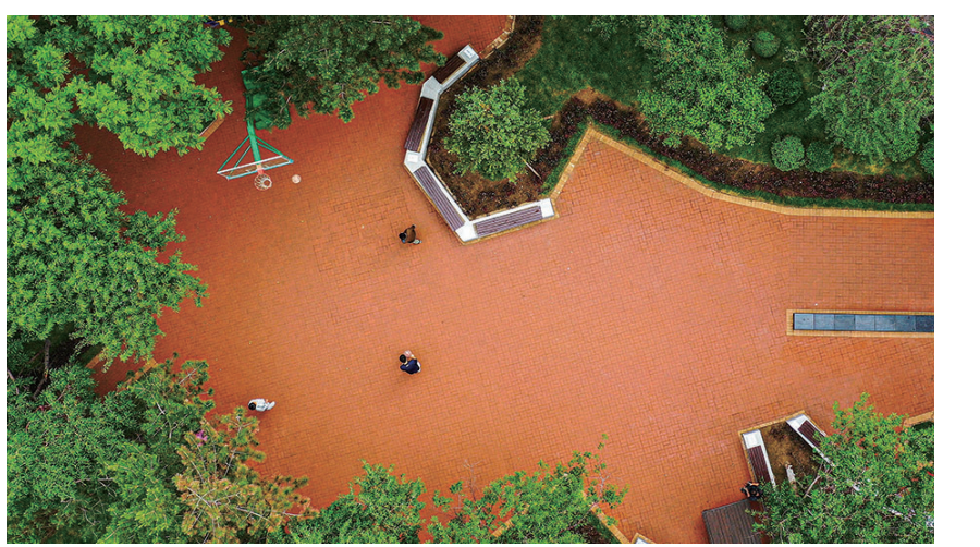
大东区草仓园口袋公园。

在沈阳市大东区大北关街与草仓路交叉口，草仓园口袋公园每天都“迎来送往”，在附近居住的不少市民都前来打卡。“我们就住公园对面，以前就常在这里打篮球，但那时的环境和现在比差远了，现在的环境太好了。” 口袋公园的建设，让这片绿地变公园，不仅新栽了绿篱、铺了草坪，还种了玉兰、宿根花卉等。考虑到附近居民的休闲娱乐，公园还增加了健身器材、休闲椅，更换了篮球架等。 记者在采访中了解到，草仓园占地1600平方米，之前为街边绿地，有一个篮球架和几张破旧的桌子等设施，且绿地与街路出入口较少，行人无法融入街头绿地中。今年在口袋公园设计之初，设计人员实地勘察并进行反复论证、征求周边市民意见，结合口袋公园建设特点，确定了此处绿地进行口袋公园建设的方案，投资20余万元。 增设了街饰家具，开辟市民活动空间，增加绿地出入口使行人方便进出。此处绿地原有松树、京桃、国槐、丁香等树木，新栽植树木有玉兰3株、红叶李绿篱50平方米、丁香绿篱50平方米、草坪200平方米、宿根花卉140平方米，增加健身器材2组、篮球架1处、广场铺装1000余平方米，座椅若干。