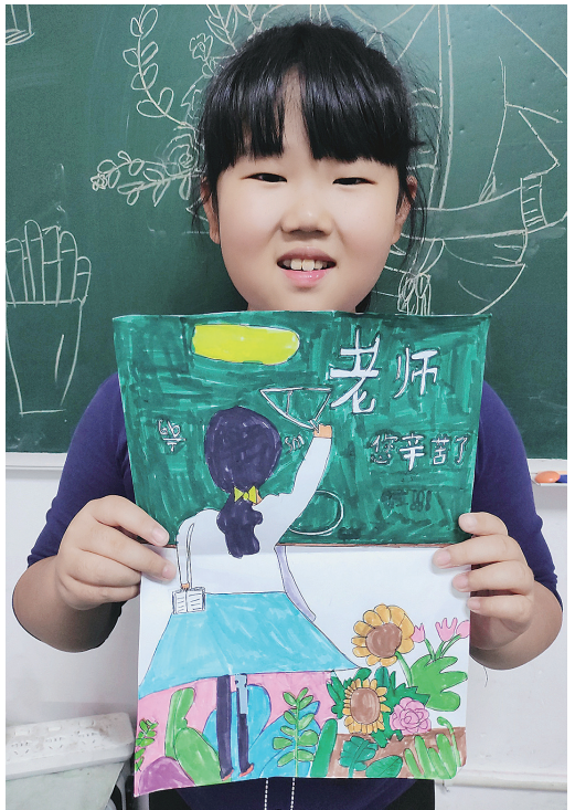
作者：程婉婷 10岁 皇姑区珠江五校实验小学

向本报投稿的行为，视为授权本报可以对作品进行推广、宣传、展示、设计衍生产品并进行销售。