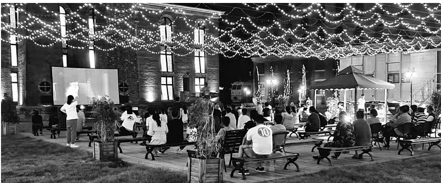
因疫情防控要求暂停放映的露天电影已重新启幕。