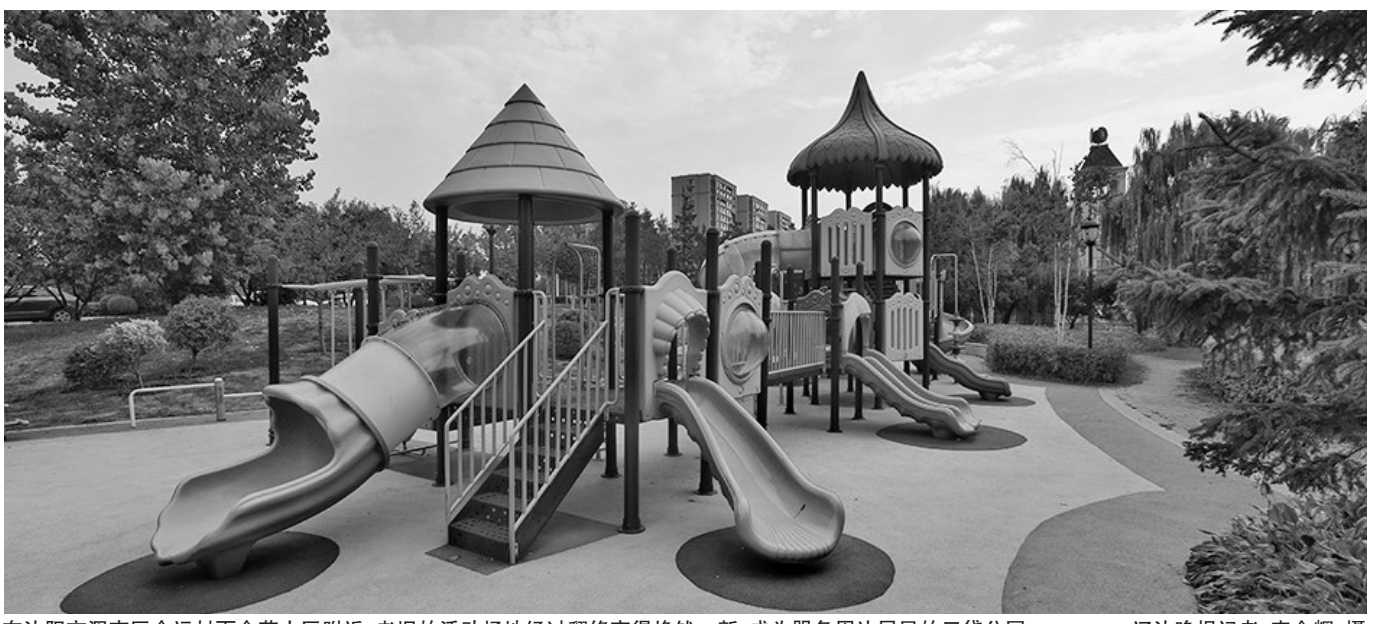
在沈阳市浑南区全运村百合苑小区附近,老旧的活动场地经过翻修变得焕然一新,成为服务周边居民的口袋公园。

晚风习习,一塘荷花摇曳。荷塘边,小孩在嬉笑打闹,大人们散步乘凉。 在沈阳市浑南区全运村百合苑小区附近,老旧的活动场地经过翻修变得焕然一新,成为服务周边居民的口袋公园。该公园在有限的空间内设置了休闲广场与步道、健身器材、儿童活动器具,打造复合型功能场地,既能满足孩子们玩耍的需求,又是周边居民健身休闲的好去处。 沈阳市浑南区环卫绿化管护中心工作人员介绍,在升级改造之前,此地只是一个小范围的 活动场所,由于修建时间较早,且没有人来维护,道路以及器械破损都很严重,周边的居民基本都不来这里活动。 浑南区在原有的基础上进行改造升级。“地面进行了重新铺设,廊架我们也通过修复刷漆进行翻新;儿童玩耍的滑梯等设施、成人的健身器材都全部修复翻新;为了方便居民休息还新增了4套座椅。” 此外,浑南区还对周边的环境进行了绿化美化。种植了海棠、五角枫球、金叶榆球、水蜡 球等花卉,铺设修复草坪1300平方米。口袋公园总面积达到了1700平方米。而在口袋公园的对面,则是一塘荷花,绿叶红花美不胜收。 重建翻新后的百合苑口袋公园成为周边居民休闲放松的好去处。茶余饭后,大人们可以沿着河边散步,观赏荷花,凉爽惬意。孩子们滑滑梯、荡秋千,笑声朗朗。附近居民刘女士饭后总会带着孙子来到这个小公园,“孩子跟小伙伴一起玩,我也能跟邻居们聊聊天,吹着风赏着花,特别舒服。” 辽沈晚报记者 胡婷婷