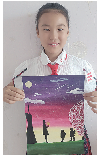
作者:张梓涵 9岁 卫工一校四年级