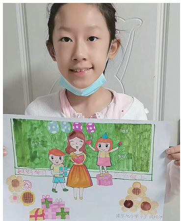
作者:闫柯伊 9岁 南京九小学