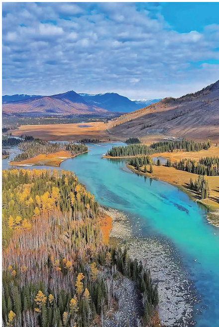
本次“夕阳红中国文化之旅”中最被游客期待的,就是新疆喀纳斯一站。喀纳斯到底有多美,仅仅在综艺节目中的“惊鸿一瞥”,就被观众