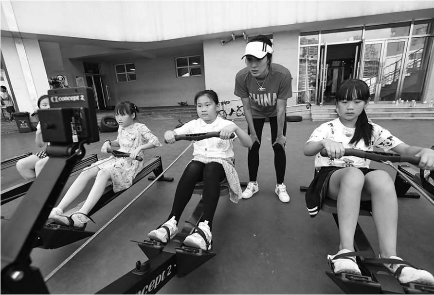
新学期沈阳多校开启“双减”大动作,孩子课余时间有丰富的选择。

学校在普惠制课业辅导之外,还开设了包括篮球、陶艺、尤克里里、国际象棋、啦啦操、爵士舞、网球、非遗传统文化糖画、绳结等40余门课程。