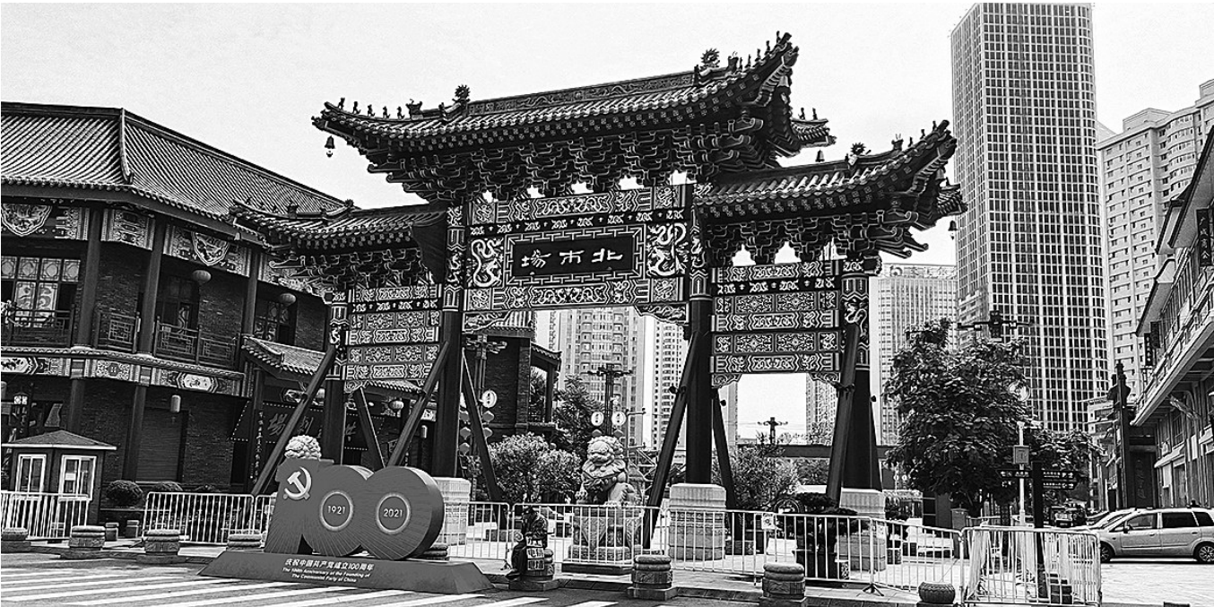
开展老北市旅游片区建设。