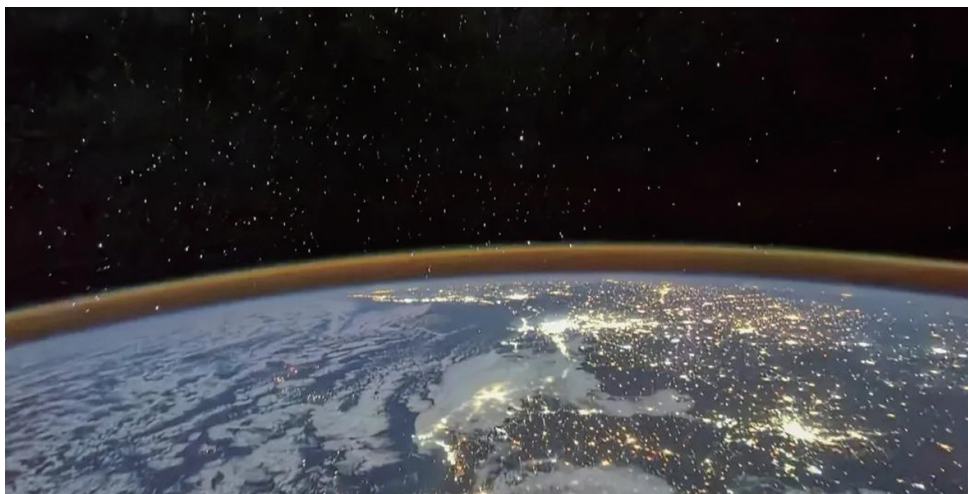
2021年7月30日,航天员汤洪波,拍摄到了北非大陆上万家灯火的盛景,宇宙中的繁星与地球上的灯光交相辉映,共同演奏出了和谐的生活乐章。