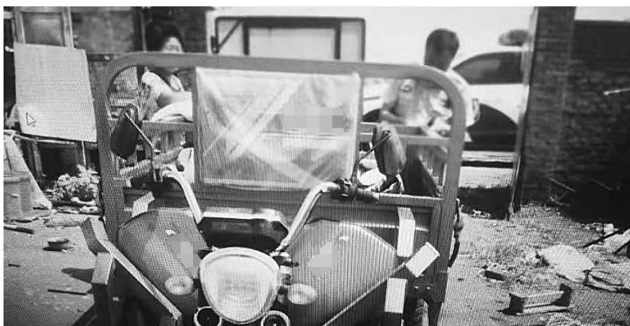
民警正在对肇事的三轮车进行查验。