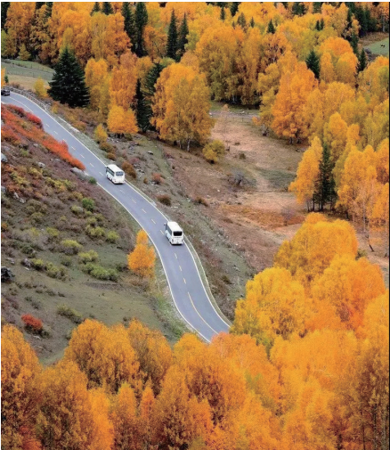
秋天的起点,是与喀纳斯的约会。