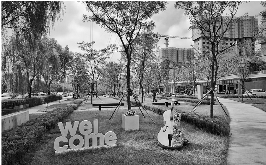
“西园和宸园”位于经济技术开发区十三号街十三号路交汇处西南侧。

“变化太大了！”许多住在附近的居民到口袋公园遛弯时，都会如此感叹一番。就在几个月前，这里还仅仅是一片普通的绿地，仅有树木