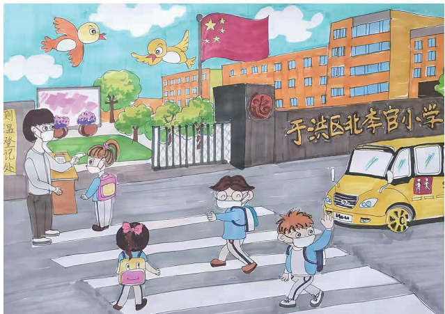
作者：索晓军，9岁，沈阳市于洪区北李官小学

作品简介 《我的学校》上学时学生与家长挥手道别和老师给孩子测温，老师每天为学生测温保障了孩子的健康安全，学生主动配合并且会对老师说一声：辛苦了。