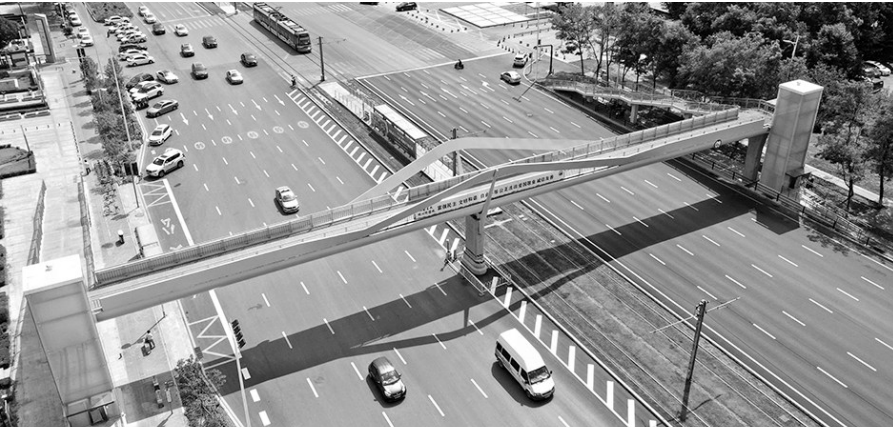
沈阳建筑大学门前过街天桥电梯安上了,但贴着“施工未完 暂未开通”字样。