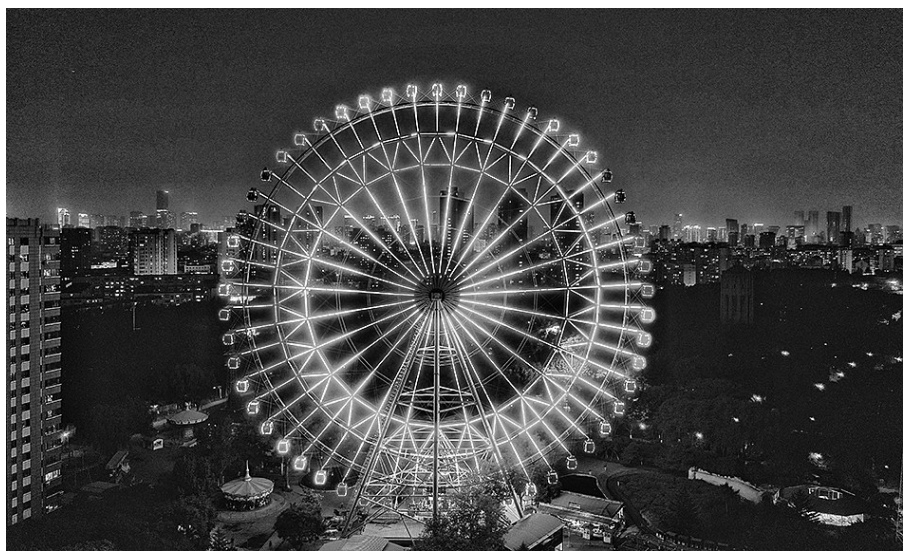
万泉公园网红摩天轮扮靓夜空。