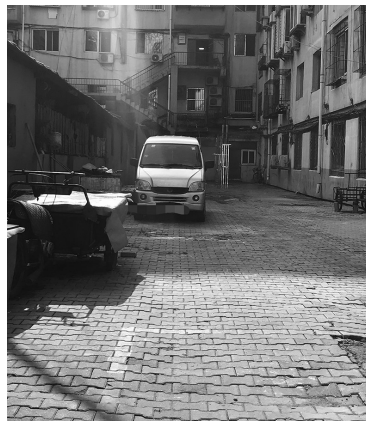
原来堆放的垃圾旧物已收拾干净。

此前,“辽沈帮帮帮”曾报道大东区华家小区91号楼与93号楼间垃圾堆放问题,报道见报后,小区所属华茂社区工作人员表示将尽快派人去现场查看情况,并积极处理。