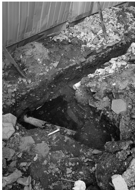
浴池新铺的管线无法与污水井连接。