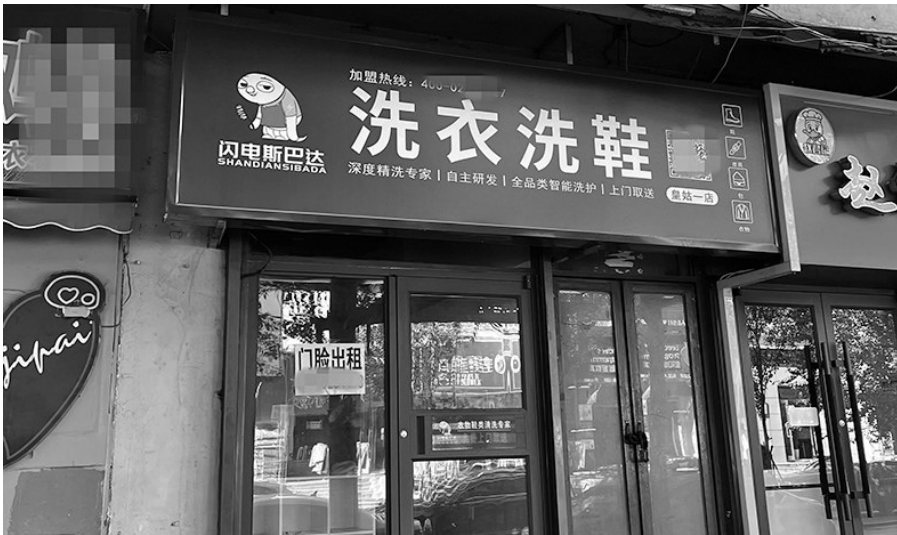
洗衣店关门,存放在里面的羽绒服不知去向,储值卡无法退费。