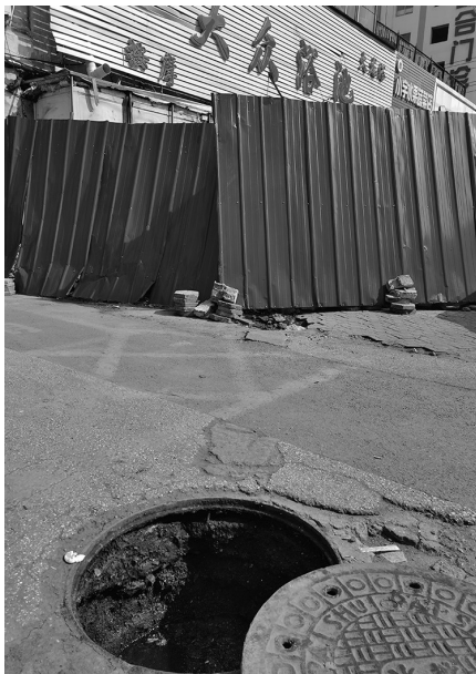
遇到雨天,污水就会外溢,臭气熏天。

沈阳市万莲街11号附近,因为马路上的污水管线堵塞,造成浴池的排水管线无法连接到污水井中,向室内返污水。