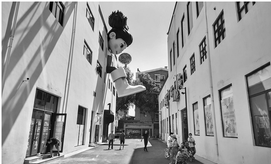
从正门往里看，一个大娃娃从楼体中探出头和奔跑的身体，十分醒目。

“去年年底，棒棒糖女孩安装好之后，马上就有人过来打卡拍照了，有时候娃娃下面站满了