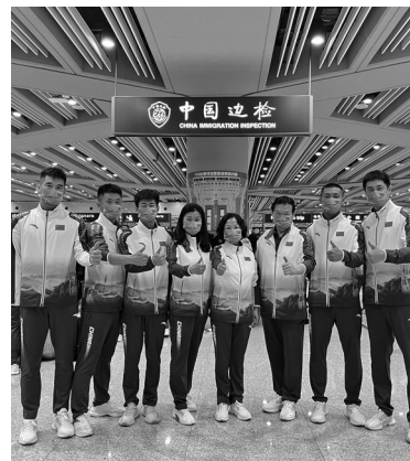
入选东京残奥会中国代表团的我省残奥健儿,出征东京残奥会。