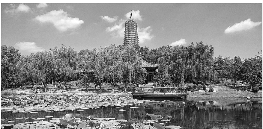
美轮美奂的舍利塔公园再现盛京八景。