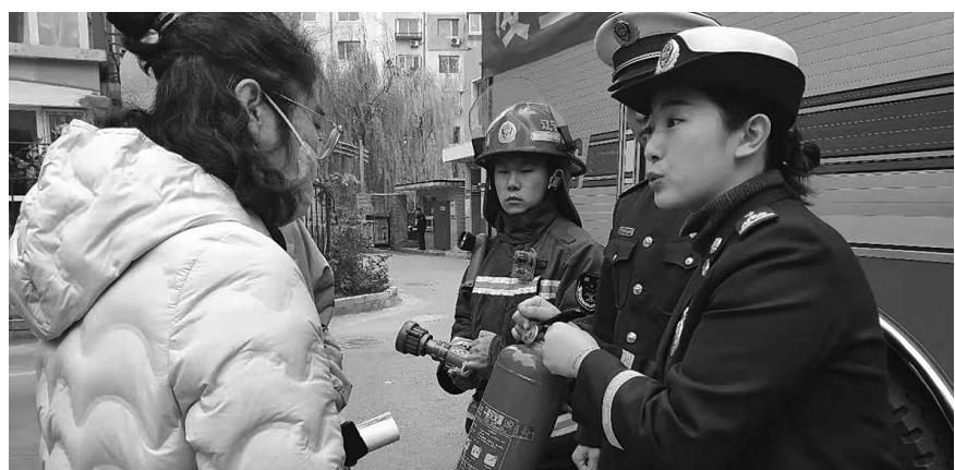
石玉向市民宣传消防常识。