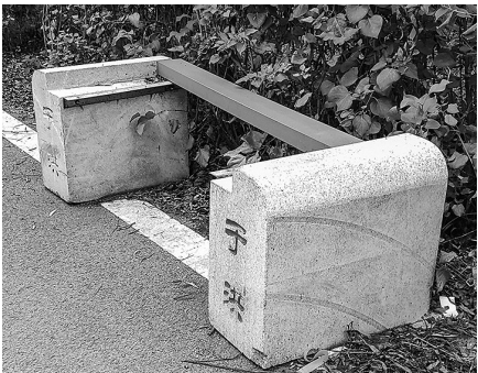
路旁的许多石凳被损坏。

记者继续向北骑行1公里左右，又发现几处被压塌的水泥路面，然后折返，从细河路向南沿着细河景观路骑行，直至微山湖街。在这段1公里左右的景观路上，同样没有石球阻拦，过往的货车也要比细河路北侧的路面多。记者还发现，路边为游人准备的石凳大部分被破坏，有些石凳上的木板不知所踪，只剩下两个石墩倒在路边……希望相关部门积极行动起来，还市民一个完整的景观路。