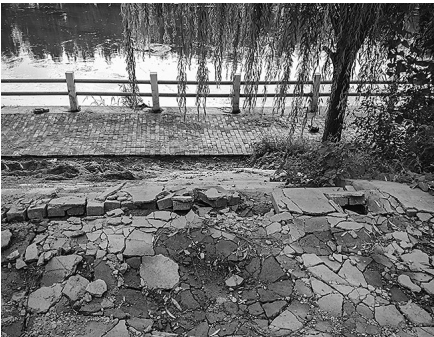
细河景观路旁的水泥路面被压塌。