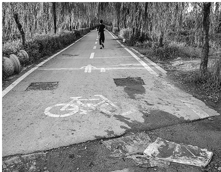
入口处的两个石球被扔在路边。