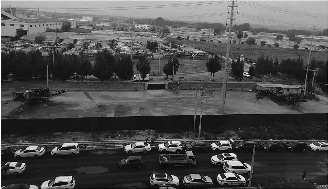
一周时间了,沙场的机器和设备未再进行施工作业。