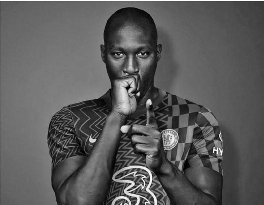
卢卡库个人历史总转会费已经来到3.085亿英镑，超越内马尔排在足坛历史第一位。

今年的联赛冠军，结果也无人看好曼联夺冠——除了13人看好曼城外，剩下7人都把支持票投给了切尔西。