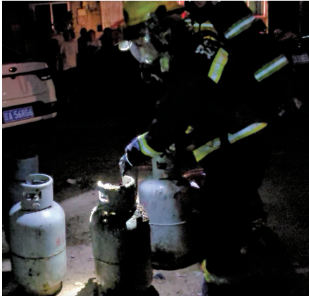
消防员们将 5 个煤气罐运到室外。 视频截图

凌晨 2 时许，居民楼一楼面馆起火，5 个煤气罐被高温炙烤，隔壁饭店和楼上居民受到威胁！ 消防员分兵三路，一路从窗口喷水给煤气罐降温，一边破拆进入饭店拎出煤气罐，还有一路挨家挨户敲门疏散全楼居民…… 8 月 12 日，这一幕发生在抚顺市望花区。消防员到场仅用 20 分钟就成功扑灭火势，还将 5 个煤气罐全部拎出，转移到安全地带淋水降温。 “8 月 12 日凌晨 2 时 04 分，我们接到指挥中心传警，有市民报警称望花区辽中街一处门市起火。”8 月 15 日，抚顺市消防救援支队雷锋消防救援站指导员朱健说。 2 时 05 分，雷锋消防救援站出动 3 辆消防车和 10 名消防指战员，02 时 10 分到达现场。“起火的门市是一家面馆，起火点是厨房调料间。”朱