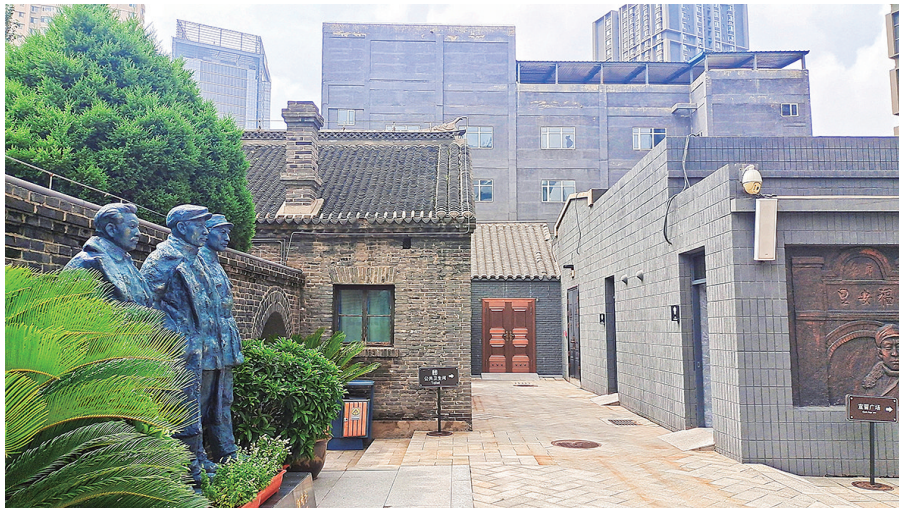
中共满洲省委旧址位于沈阳市和平区皇寺路福安巷3号。

在沈阳市西北角，和平区皇寺路福安巷3号(原北市场福安里4号)，有一个门额上刻有“福安里”的巷子口。这里就是中共满洲省委旧址所在地。