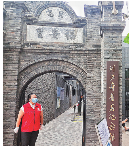
刘少奇故居纪念馆。

中共满洲省委于1927年10月建立，是中国共产党在东北设立的第一个最高统一领导机构，是党在东北革命的源头和摇篮，随着东北地区革命形势的发展，1927年党的“八七”会议后，中共中央陆续派陈为人、刘少奇、林仲丹、陈潭