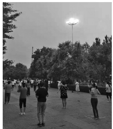
北塔公园牌楼后面的高杆灯修好了。

“辽沈帮帮帮”此前报道:7月29日风雨过后,北塔公园牌楼后面的高杆灯的6组灯泡全坏了,市民跳舞健身非常不方便。