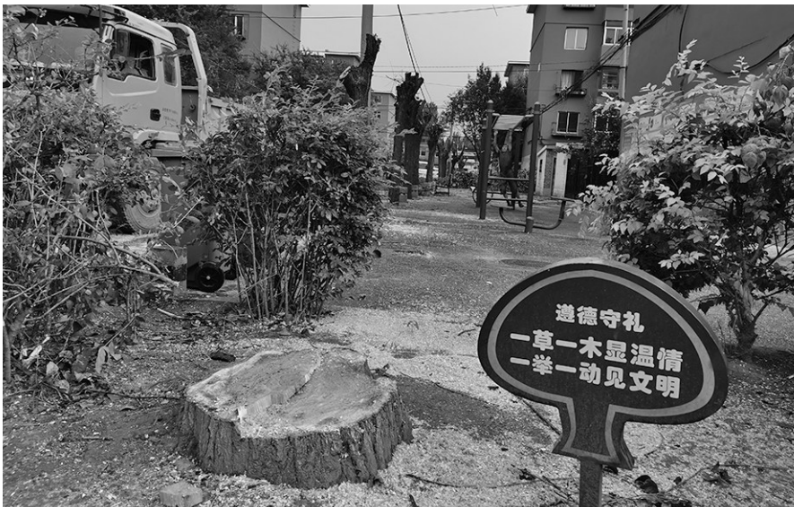
直径达半米多的大树被砍得只剩下树根。

一周时间内,在皇姑区三台子街道牡丹社区辖区两次对树木进行砍伐,无人制止。 社区回应:伐树作业是中城物业负责。 物业回复:有无批件得问街道和社区。