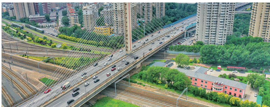
横跨铁路的沈阳公和桥。

太阳还在自顾自地挥洒着青春的光芒,遂川路已停止了喧嚣,回复一整天的低调宁静。明天清晨,遂川路依然会烟火十足,活色生香。因为它所在的城市、它所在的国家,富足幸福!