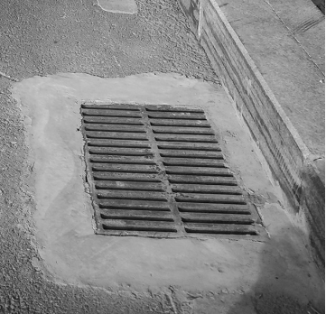
丢失的雨水篦子井盖已经补上。

7月16日，“辽沈帮帮帮”报道了在沈阳市保利·海德公园南侧几百米长的马路上，竟然有7个雨水篦子井盖不知去向，给途经此地的车辆和行人带来不小的安全隐患。 昨日下午，记者途经该现场查看，发现原来丢失的雨水篦子井盖已经补上，并在四周用水泥涂平，途经此地的车辆和行人再也不用担惊受怕，为相关部门的施工速度点赞。