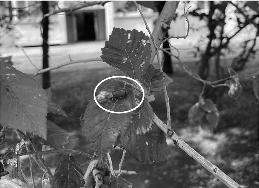
榆树生虫害，新长的树叶快被虫吃光了。