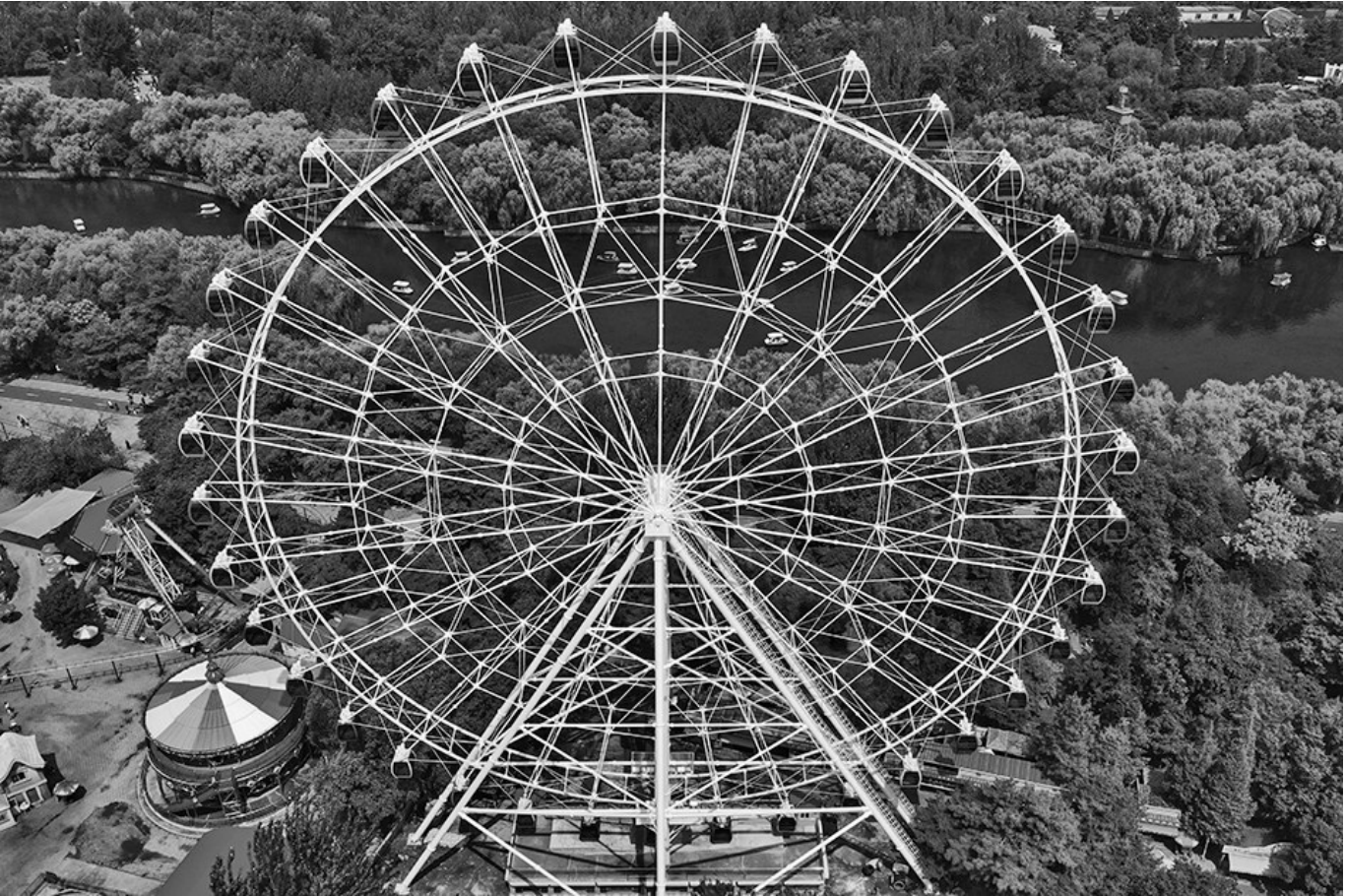
沈阳南湖公园新版摩天轮亮相。

摩天轮为啥要改造?从什么时候开始改造的?什么时候开始运营?带着市民对摩天轮的关注,记者采访了南湖公园管理中心相关负责人,他向记者一一解答了这些问题。 据悉,截至去年,这个在1998年4月建成的摩天轮已经有22年的历史,接待游客达数百万人次。“设备和部件已临近使用寿命,安全系数比较低。因此,南湖公园才决定对摩天轮进行拆除,并重新修建。” 工作人员透露,为确保游客的安全,去年5月1日就暂停了摩天轮的运营,并决定在冬季维养期对其进行拆除。“去年10月中下旬开始改造,准备今年五月份正式营业,受疫情影响加上天气的因素,中间施工停了一段时间,导致工期延期。不过,现在所有的部件已经安装完毕,目前,国家相关检测部门正在检测,待检测合格的报告出来以后就可以运营,预计得8月下旬才能试运营。” 记者在采访中了解到,改造升级前的摩天轮曾大修过一次,“记得在2013年摩天轮运营15年的时候大修过一次,这次摩天轮已经到了