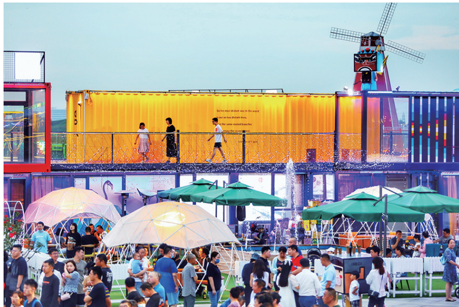
沈阳市和平区融·IN BOX集装箱小镇。