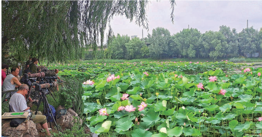
北塔公园的荷塘美景远近闻名。

在沈阳市皇姑区崇山东路北塔街上，藏着一个十分有韵味的公园。 这个公园独特韵味在于，历史古迹与美景的交相呼应，人在公园中，感受到的是浓浓的历史感和强烈的景色之美。 这个公园北侧为护国法轮寺，西侧为新开河。它的名字也因其北侧伫立着著名的清初四塔之一的北塔而得名。每年七月，园内荷花绽放，成为不少摄影爱好者的打卡地。这个公园就是北塔公园。 日前，记者来到北塔公园，在北塔人工湖旁看到，这里正在上演“接天莲叶无穷碧”的美景，吸引不少市民前来休闲、赏景。现场还有多名摄影爱好者，在湖边专注拍摄荷花绽放的美景。一位附近的居民告诉记者，每年进入七月，这里的荷花陆续开放，最佳观赏时间可以持续一个多月。“特别是夏日雨后的湖边，阵阵荷香扑鼻，让人感觉清新又美好”。 呼吸着公园内清新的空气，探访法轮寺、北塔等古迹，与历史对话，赏园内各类植物，拍下美美的照片，整个人感觉轻松自在，但内心的积淀却丰富了不少。 位于公园北侧的北塔，为清初皇太极敕建的环绕盛京城东、西、南、北“四塔四寺”之一塔，始建于清崇德8年(1643年)，建成于顺治二年(1645年)，距今已有300多年历史。清乾隆皇帝东巡时曾亲书“金镜周圆”匾额。并由乾隆皇帝亲书“护国法轮寺”匾额，至今保存完整。 皇姑区城管局相关负责人介绍，北塔公园建于2003年5月，占地面积为15.2万平方米。公园内现有各种针叶阔叶乔木3500余株，灌木整型树3300余株，栽植水生花卉2000余平米。北塔公园分成4个大的功能区，包括历史文化保护区，位于公园西北部，以法轮寺、北塔为核心，可以满足文物古迹参观、游览等的需要；康体休闲区，位于公园中部，以运动场为核心，市民可以在这里休闲健身；综合活动区，位于公园中部核心部位，由广场群和大型疏林草地等组成，是人流最集中、功能多样的一个区域；水上活动区位于公园的西南部，近年对湖面重新做防淤，湖边重新绿化，栽植水生植物。“北塔公园作为一个满足休闲、娱乐、游览和科普需求的综合城市开放空间，为沈阳东北部的市民提供了良好的休闲好去处”。 辽沈晚报记者 朱柏玲